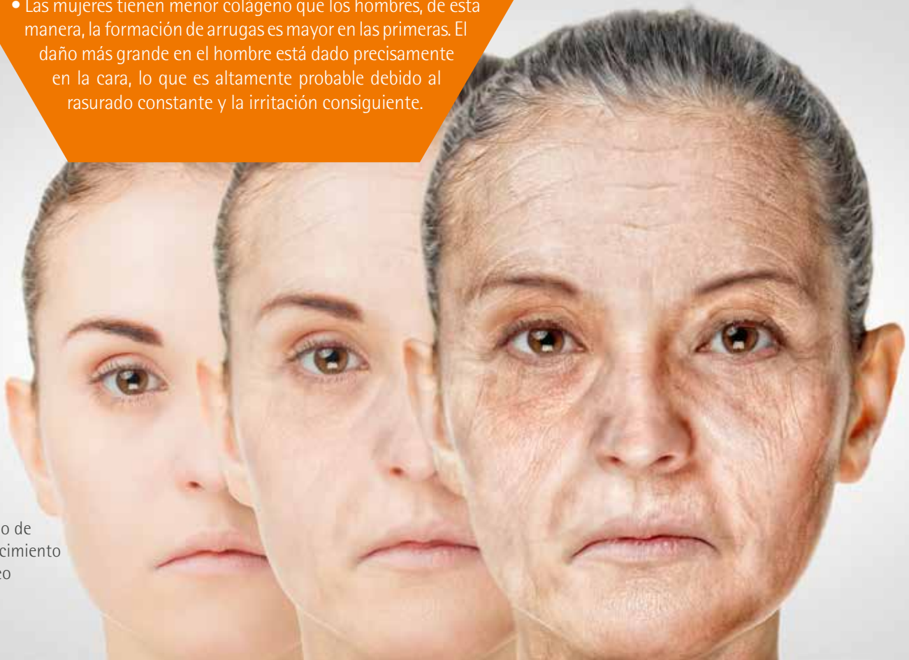
Ejemplo de envejecimiento cutáneo