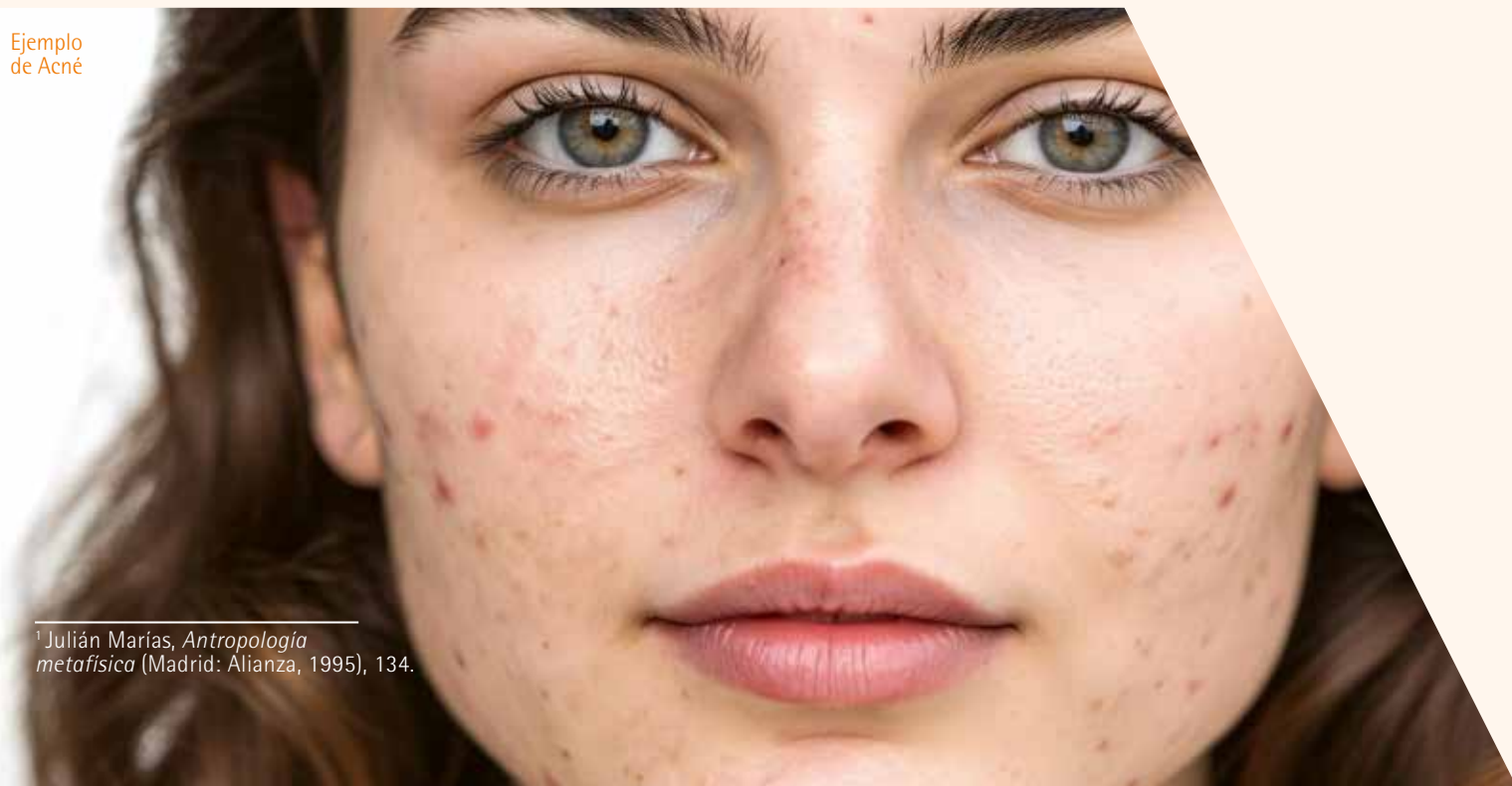
Ejemplo de Acné

Por supuesto que en los casos de acné más extendidos y rebeldes (recordemos que el acné como la mayoría de las enfermedades dérmicas conservan bases generales, pero también manifestaciones particulares según el paciente), tienen el agravante que, al presentarse en la cara, implican