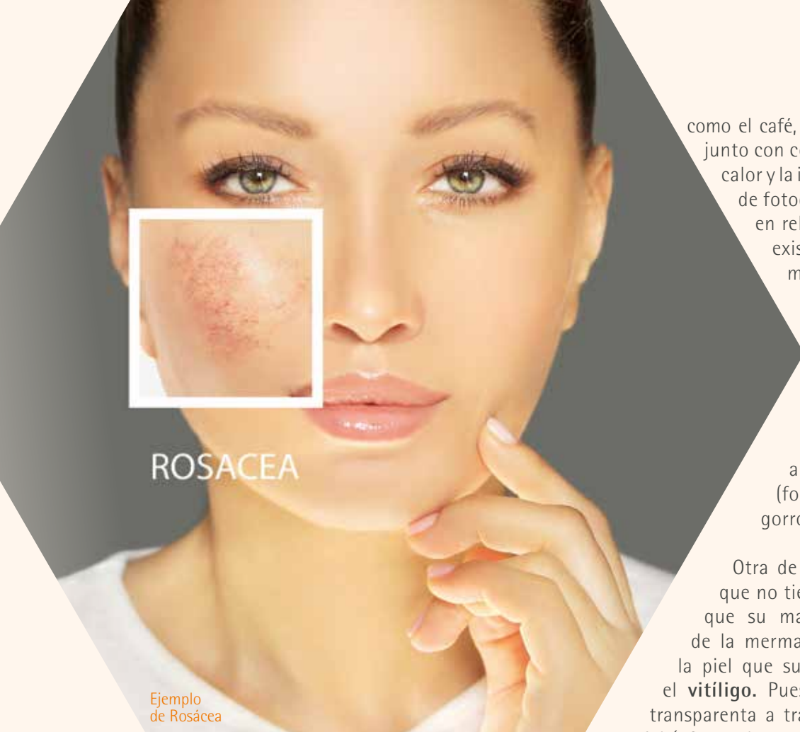
Ejemplo de Rosácea

como el café, el té, la sopa o ciertos aderezos, junto con condiciones ambientales como el calor y la influencia solar y la acumulación de fotodaño. Por eso es que, sobre todo en relación a estas últimas variables, existe una instancia en la época más tórrida -más aún con el aumento de las temperaturas que se han registrado- que eleva la posibilidad de que la rosácea pueda agravarse si no se toman al menos las precauciones básicas a la hora de exponerse a la radiación solar, por ejemplo (fotoprotección adecuada, uso de gorro, lentes solares).